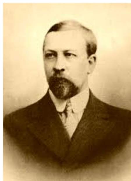
Владимир Францевич Эрн (1882—1917)