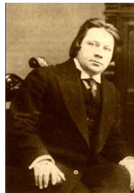
Фёдор Августович Степун (1884—1965)

Николай Бердяев предупреждал об опасности, таящейся в новой мистике, «утилизировать себя для традиционных общественных [читай, революционных — В.Г.] целей» и даже требовал «радикальной реформы» интеллигентского сознания — «объективирования» его неожиданного мистицизма в «положительную религию», чему больше всего должен способствовать «очистительный огонь философии» [Бердяев 1991, с. 29].