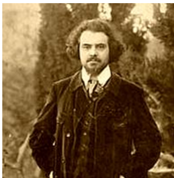
Николай Александрович Бердяев (1874—1948)

«Ваше дело, ваша книга есть событие, событие чистое, христианское, русское! — писал авторам сборника архиепископ Антоний (Храповицкий). — Знаю, что и эти сочувственные строки вам вменят в укор, а не в честь, но любовь не ищет чести, а взаимного отклика. И без смущения свидетельствую я, что ваш высокий духовный подъём заставит и меня с седеющею уже бородою взглянуть более примирительным взором на жизнь нашего ренегатского от народа и родины общества и не считать его окончательно погибшим для Царства Божия. Поклон же вам и привет, и Божие благословение, добрые русские писатели» [Архиепископ Антоний (Храповицкий) 1998, с. 347].