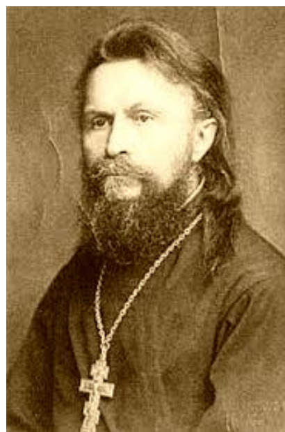
Сергей Николаевич Булгаков (1871—1944)

И Сергей Булгаков, опять же, буквально каялся в своей известной статье за «характерную для нашей эпохи интеллигентскую подделку под христианство, усвоение христианских слов и идей при сохранении всего духовного облика интеллигентского героизма. Каждый из нас, христиан из интеллигентов, глубоко находит у себя эту духовную складку» [Булгаков 1991, с. 62].