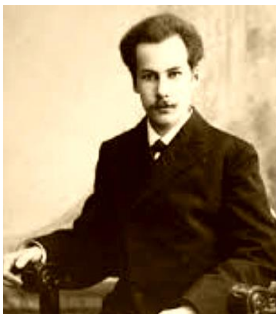
Андрей Белый (Борис Николаевич Бугаев, 1880—1934)

Иными словами, академические горизонты философии расширились, но академизм из неё не совсем исчез. Заявленное Бердяевым от лица русской мысли преодоление европейского рационализма «на почве высшего сознания» [Бердяев 1991, с. 26] проходило скорее с демонстративным, чем с реальным отбрасыванием рационалистических лесов. Вот лишь несколько примеров-наблюдений. Символизм Андрея Белого мотивируется кантианской строгостью и чурается адогматического «анархизма», будучи противовесом вольным теоретическим построениям его соратников, проповедующих религиозное творчество вне трансцендентальных штудий темы о возможности религии как таковой [Белый 2012, с. 327, 359]. А «оно-матология» отца Павла Флоренского, замешанная на народническом сплаве «именопочитания» и магизма, весьма напоминающая своим «словарём имён» настоящий гороскоп (и от подобной «литературы» отличающаяся лишь «златоустовски-медоточивой», как писал Г. Гачев, манерой письма), уравнивается дотошно иссекающей чеканными категориями всё сущее, включая догмат над-сущей Троичности, вполне схоластической диалектикой Алексея Фёдоровича Лосева.