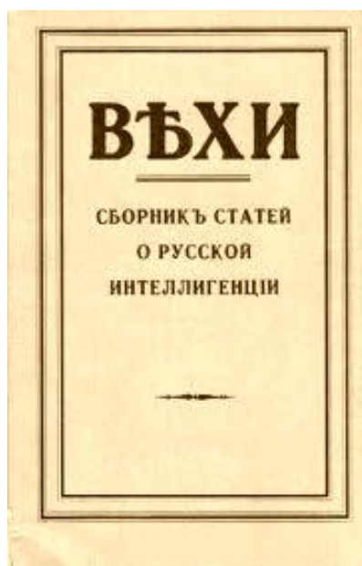
Обложка сборника «Вехи. Сборник статей о русской интеллигенции» (Москва, 1909)