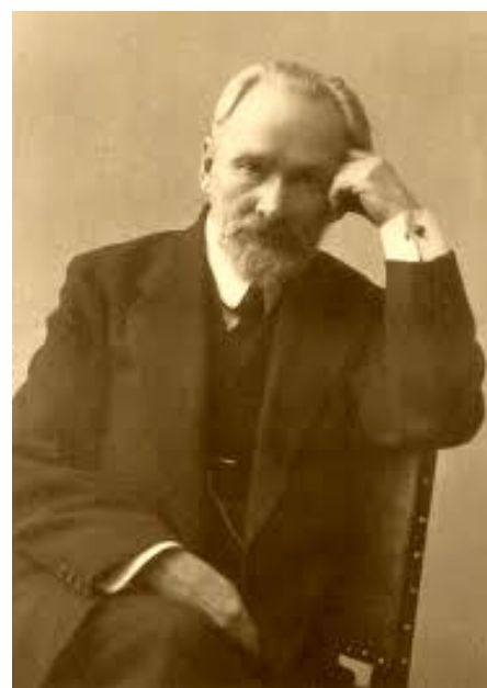
Василий Васильевич Розанов (1856—1919)