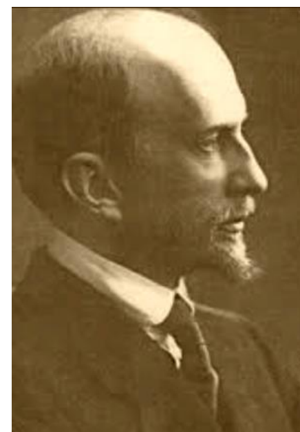
Иван Александрович Ильин (1883—1954)

И эмоционально мыслящий Бердяев в своих заявительно-утверждающих или заявительно-отрицающих эскападах в итоге вовсе не менее «предметен» и близок аскетической методологии «очевидностей», нежели его противоборец Иван Ильин, чуждый всем «безответственным выдумкам». Даже прихотливейший стилист В.В. Розанов, шокировавший воспитанную на классической прозе читательскую публику своими нарочито бессистемными сентенциями, подлавливающими автора то «в конке», то «за нумизматикой», то и вовсе «на обороте транспаранта», хоть и близок роняемыми «опавшими листьями» потоку сознания нынешнего блогера и ЖЖ-писца, на самом деле конструирует своё «Уединённое» как строго выверенный модернистский роман, а своё предназначенное «ни для кому» пятидесяти томье строит по плану и в духе философского академизма XIX века, столь творчески им «взорванного», но и бывшего ему идейным воспитателем 3 .