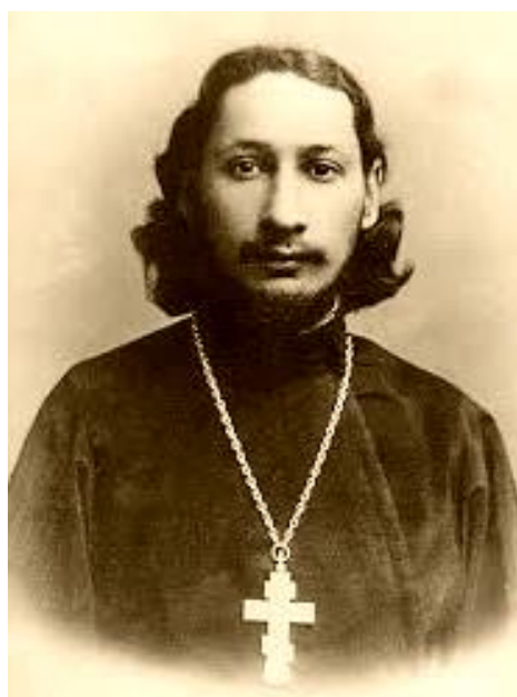
Павел Александрович Флоренский (1882—1937)